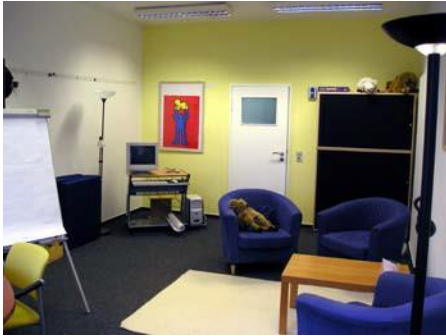
Therapieraum in unserem Ausbildungszentrum in der Innsbruckerstraße in Berlin