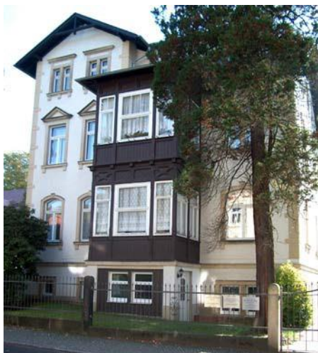
Unser Ausbildungszentrum in Dresden

Die praktische Tätigkeit findet in klinisch-psychiatrischen Einrichtungen statt. Sie umfasst unter anderem die angeleitete Durchführung von diagnostischen Erhebungen, Untersuchungen und Mitwirkung an psychotherapeutischen Behandlungen bei PatientInnen mit unterschiedlichen psychischen Störungen und Erkrankungen in unterschiedlichen Settings.