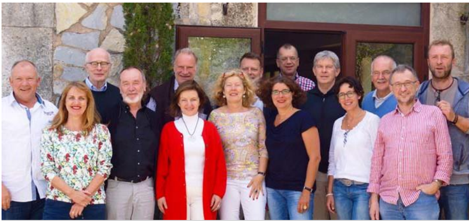
Die LeiterInnen unserer regionalen Ausbildungszentren